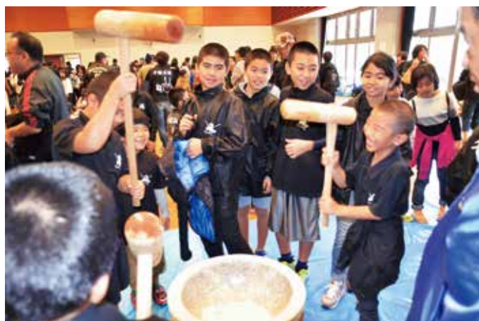
新春もちつき大会