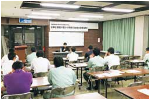
男女共同参画研修会

男女共同参画社会の実現に向けて、男女が社会の対等な構成員として自らの意志によって社会のあらゆる分野における活動に参画し、個性を活かし活躍することができるまちに向けて取り組みます。