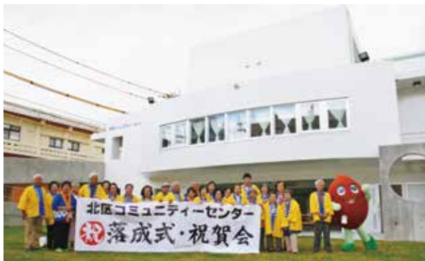
北区コミュニティセンター落成式

地域のふれあいや絆を深めるために、自治会や各種団体などの活動支援と連携の強化を図り、コミュニティ活動の充実に向けて取り組みます。