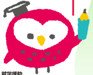
就学援助 イメージキャラクター ツクロウくん

学校教育法などにもとづいて、小中学校の子どもがいる家庭に学用品費や学校給食費などを市町村が援助する制度です。子どもたちの安心して楽しい学校生活のために、気軽に就学援助制度を活用してみませんか。