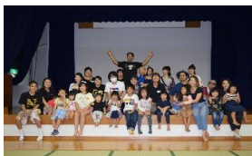
たくさん遊んだなあ〜 全員でハイポーズ!