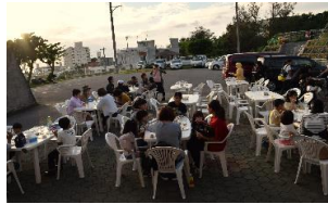
外で食べるお肉は最高♪