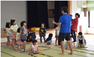
子ども達の真剣なまなざしが印象的でした

「ごちゃませレク」、第2回目を3月に行います。ぜひ皆さまの参加お待ちしております!