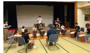
太鼓を叩いているうちに自然と笑顔に〜♪