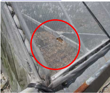
ネット等の破れの補修