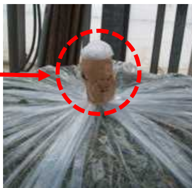
ビニール袋の口をしっかり閉める