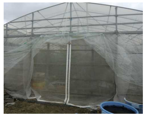
ファスナー付きカーテン