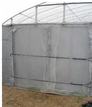
二重カーテン+留め具