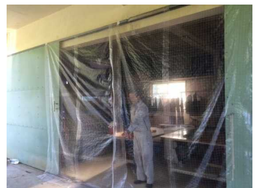
集荷場入口のネット設置