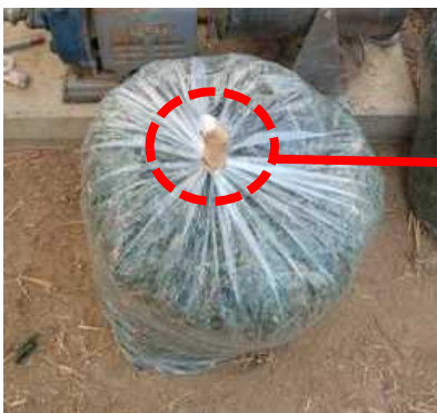
果実残渣等をビニール袋に入れて処分