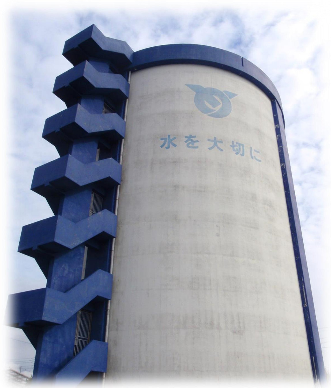
嘉手納町久得配水池